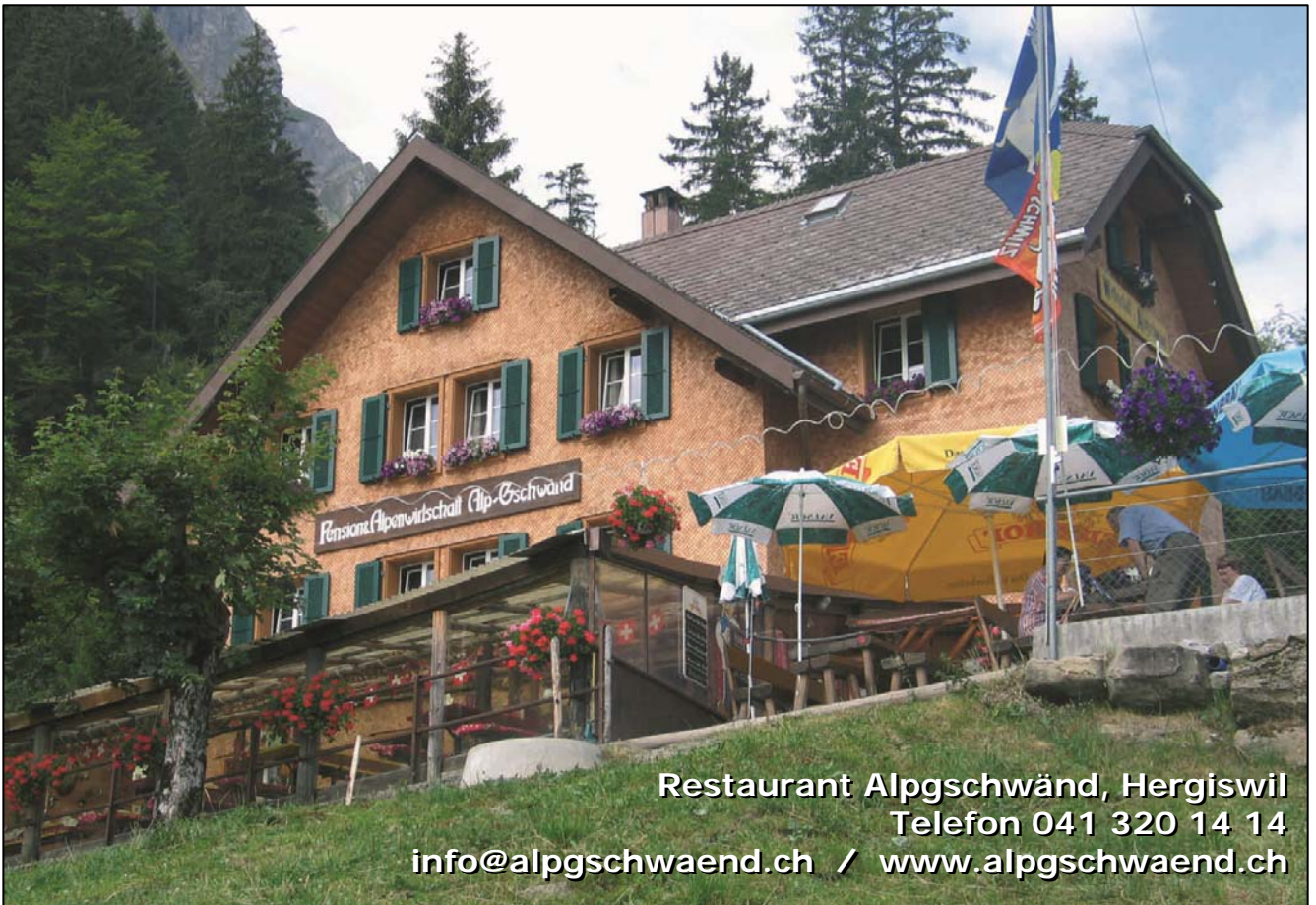
Restaurant Alpgschwänd, Hergiswil Telefon 041 320 14 14 info@alpgschwaend.ch / www.alpgschwaend.ch