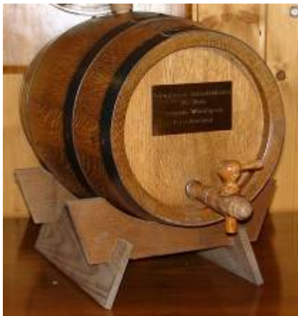
Wanderpreis «Gruppe Ausserkantonale» (Sponsoren: Geschwister von Rotz, Stans)

Die Laufzeit einer Auszeichnung beträgt 10 Jahre. Bei Erneuerung der Sektionsauszeichnungen sind wieder alle Schützen gewinnberechtigt.